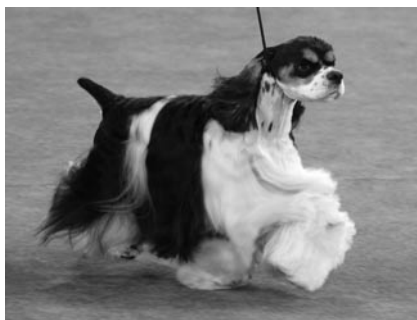
Afterglow Tristar, ow. Brown & Roberts

предпочтительный в США тип в 1930-е годы привел к появлению отдельной породы. Несмотря на то что большинство стран