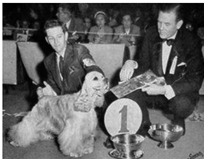
Carmor's Rise And Shine