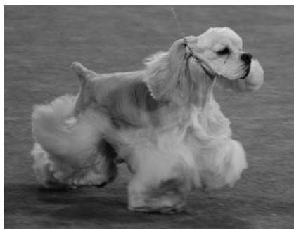
Trinity's Tucked Under His Wing, ow. Gray & Dobmeier

сохраняет английский стандарт, уже сегодня наблюдаются отличия в стандартах англоязычных стран: Канаде, Южной Африке, Австралии и Новой Зеландии. Похожая ситуация складывается у спрингер-