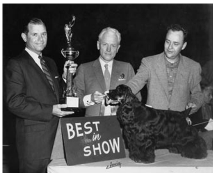
Pinetop's Fancy Parade

количество (в основном за счет собак американского типа) на выставках зачастую превышало 3000. Мог ли получиться иной сценарий? Риторический вопрос, ответ на который можно найти, обратившись к другим породам. Например, немецким догам, боксерам, стандартным таксам и шнауцерам. Представители этих пород когда-то разительно отличались от европейских собратьев, но прошло время, которое имеет свойство все расставлять по своим местам, и сегодня породы консолидировались. Удачные решения американских кинологов